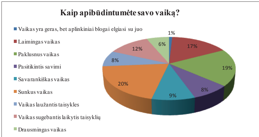
2 pav. Tėvų požiūris į savo vaiką

Daugiausia tiriamųjų teigia, kad jų vaikas yra sunkus, tad galime daryti prielaidą, kad tėvams yra sunku išbūti šalia vaiko ir jie vaikui nuolat pasako apie tai, ką jis padaro blogai, šitaip vaikas gauna tėvų dėmesį, kai elgiasi prastai. Vadinasi, nesąmoningai tėvai pastebi vaiką tik tada, kai jis elgiasi netinkamai, skirdami vaikui dėmesį už netinkamą elgesį, sudaro sąlygas jam pasijusti reikšmingam, o nepastebėdami, ką jis padaro gerai, atima iš vaiko galimybę būti pastebėtam už pozityvų elgesį. Nemaža dalis tėvų išskiria, kad jų vaikas yra paklusnus. Galima daryti prielaidą, kad įvestos taisyklės sudarė sąlygas vaikui išsiugdyti paklusnumą. Tik tėvų paklusnumo supratimas labai skirtingas, tad paklusnūs vaikai gali būti ir tie, kurie visiškai pasiduoda tėvų taisyklėms, kurios slopina vaiko asmenybės ugdymąsi, ir tie, kurie laikydami taisyklių sužino ribas, kur reikalinga besąlygiškai paklusti, o kur galima laisvai veikti ir užsiimti kūrybą ir kur reikia keisti netinkamą savo elgesį į tinkamą, kad patenkintų savo poreikius. Šeimos yra labai skirtingos ir vaikų paklusnumą suvokia skirtingai. Kiek mažesnė dalis tėvų savo vaikus vadina laimingais, o laimingas gali būti visapusiškas vaikas: fiziškai stiprus, emociškai „raštingas“, socialus, protingas ir pasižymintis harmoningais charakterio bruožais bei siekiantis kūrybinės veiklos.