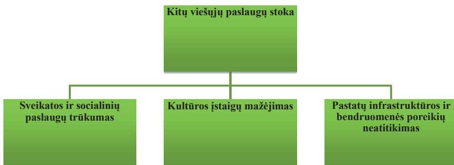
3 pav. UDC steigimo prielaidos, paaškinančios kategoriją „Kitų viešųjų paslaugų stoka“

Kategoriją „Viešųjų paslaugų stoka“ apima tris pagrindines subkategorijas: sveikatos ir socialinių paslaugų trūkumas, kultūros įstaigų mažėjimas, pastatų infrastruktūros ir bendruomenės poreikių neatitikimas.